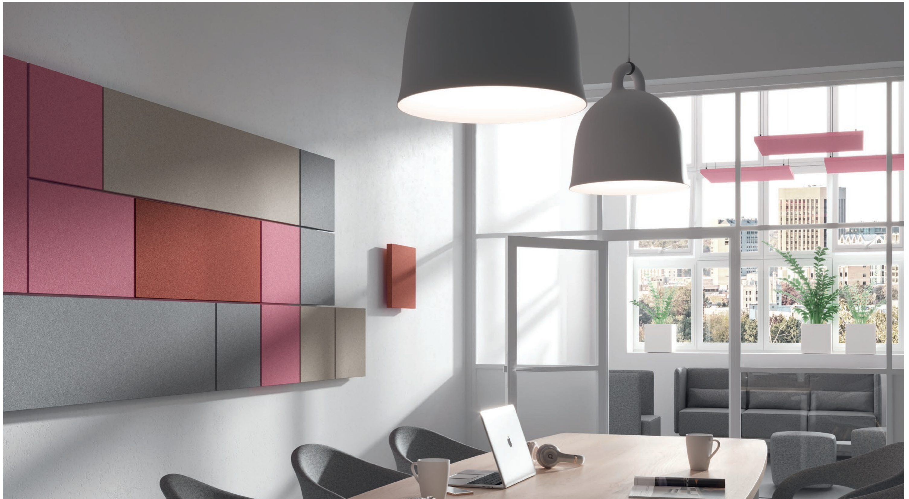
Mit den eckigen Absorberelementen lassen sich wahre Kunstwerke schaffen. Klare Linien, klare Formen, interessante Farbvariationen und Anordnungen.