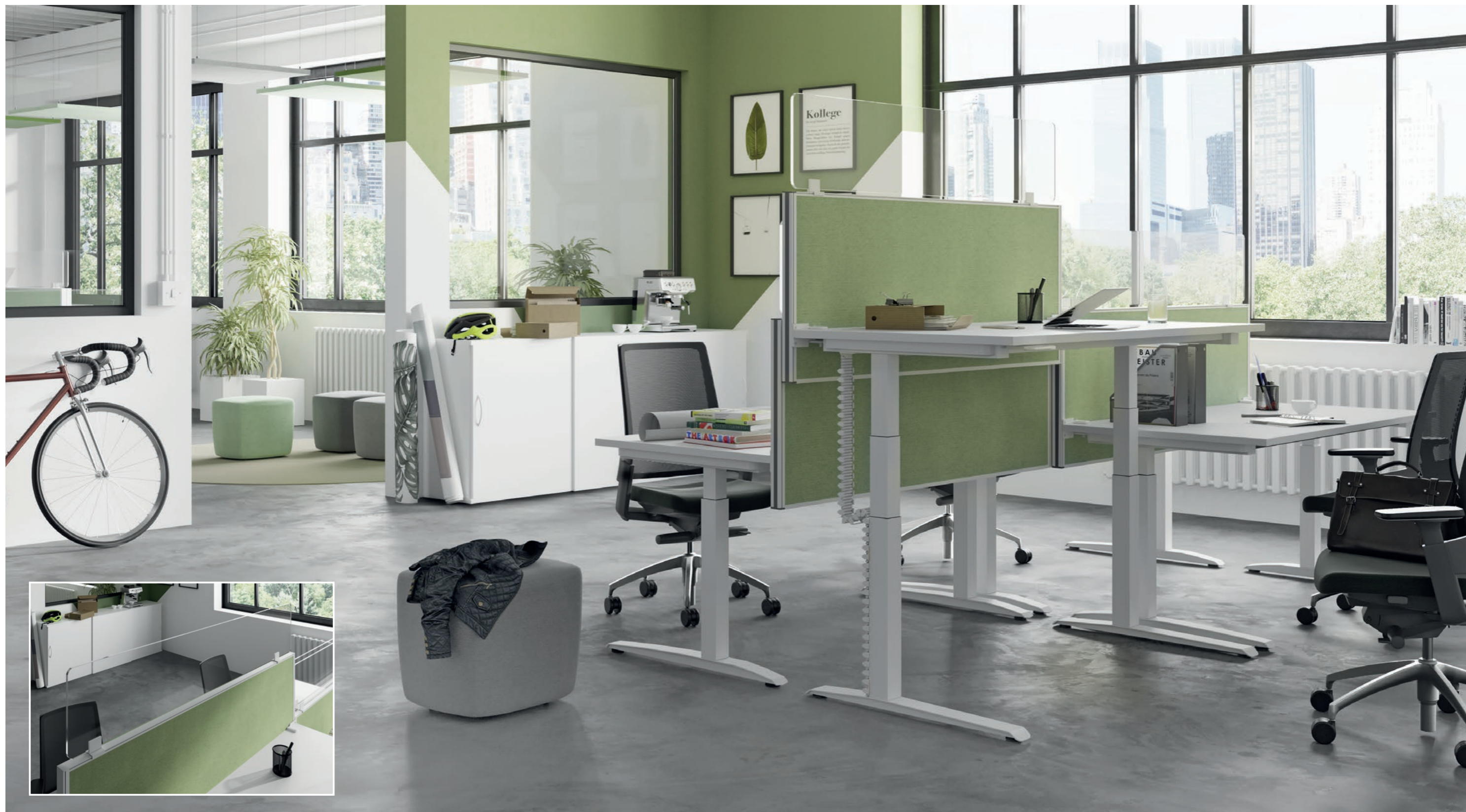
STELLWAND MIT GLASAUFSATZ HINTER-TISCHAUFSATZ STOFF: LUCIA Y096: APPLE

Der 30 cm hohe Glasaufsatz sorgt für erweiterte Sicherheit im Social Protecting und fügt sich mit den abgerundeten Ecken harmonisch in das Gesamtbild ein. Erhältlich ist der Aufsatz in Klarglas Acryl 5mm oder in Klarglas ESG 5 mm in verschiedenen Längen (800 - 2000 mm)