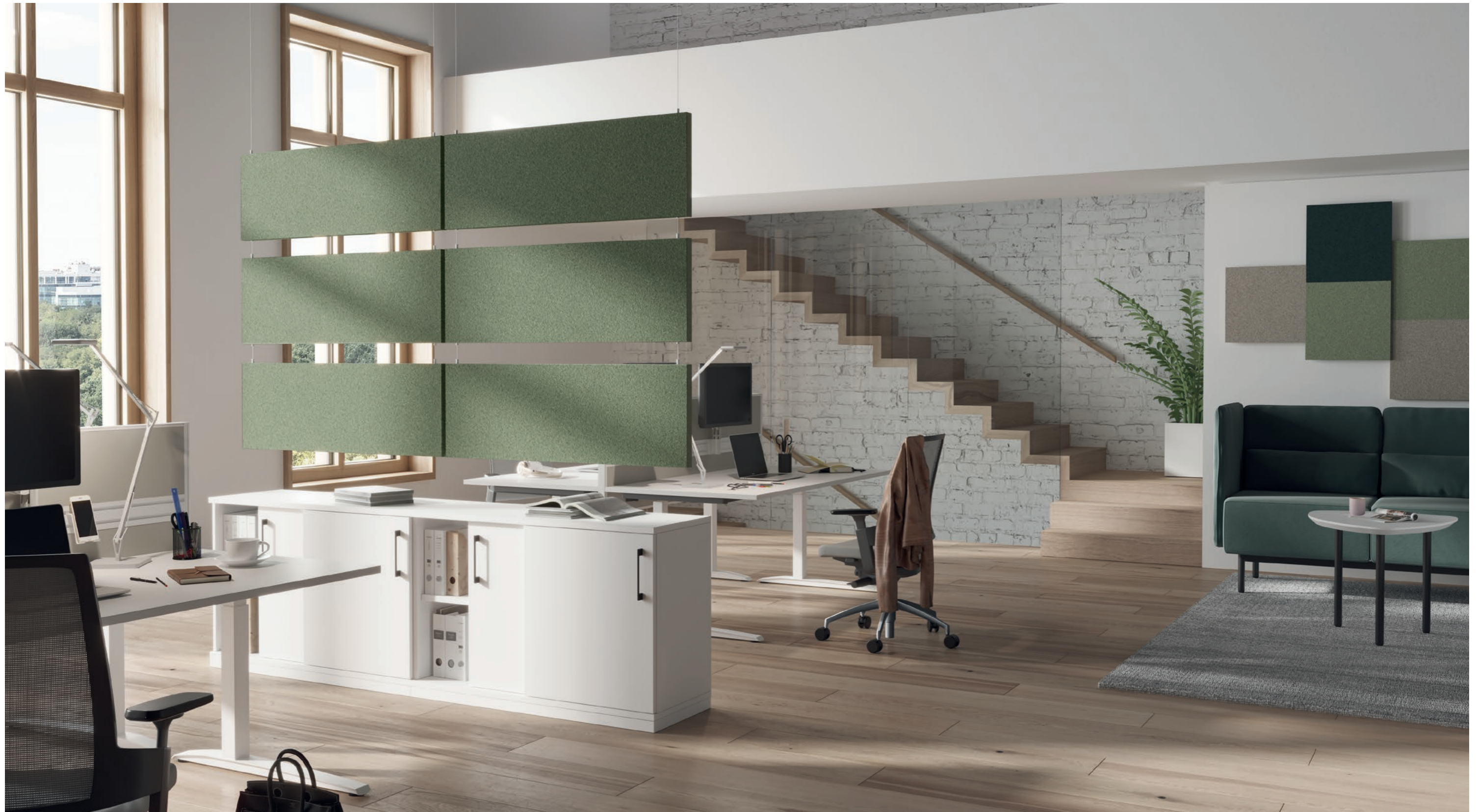
BAFFEL (OBEN, MITTE, UNTEN) STOFF: BLAZER LITE LTH60 SHELTER

Die Baffel sind in den Formaten und Anordnungen individuell einsetzbar. Als optische Raumteilung oder als Akustik Elemente in Reihe unter der Decke hängend geben sie Arbeitsbereichen Struktur und sorgen gleichzeitig für eine gute Raumakustik.