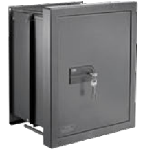
WT 616 K