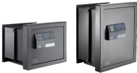
WT 614 E FP