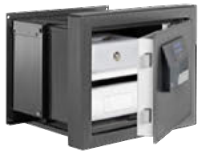
WT 614 E FP